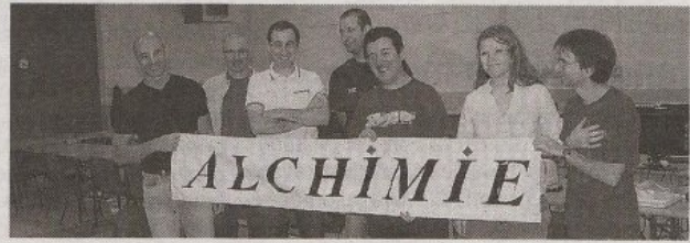
La rencontre a été conviviale.

tional. De toute la France, des intervenants, utilisateurs et développeurs ont fait le déplacement jusqu'à la salle des fêtes de Clérieux pour participer à ces rencontres conviviales. Une rencontre rare, qui a permis au public d'en savoir plus sur l'informatique et son évolution, depuis un quart de siècle en Europe.