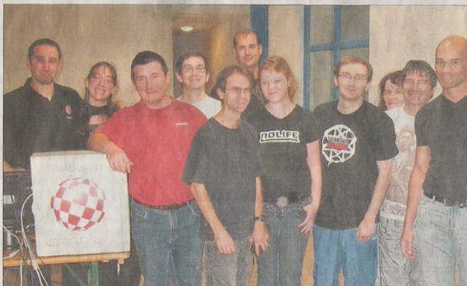
□ Les membres de l'association Triple A en réunion de travail.

Parallèlement, l'association a une activité soutenue : elle sera en Suisse le week-end prochain pour une rencontre internationale des utilisateurs d'Amiga, le 1 er octobre, elle sera à Arles à la convention des arts numériques (Main-Espace-Party), le 17-10 : au campus de la Doua (université Lyon 1) pour la journée du Logiciel Libre et enfin à Grenoble le 24-10 pour la Fête de la Science. Pour 2011 ce sera en mars une présence renforcée à Eurex-Po pour le Salon Primevère.